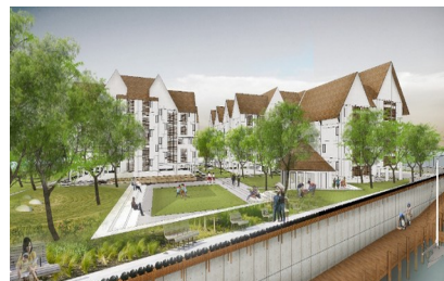
Planungsansicht "Kampung Aquarium in Jakarta. Sozial inklusiv, gesicherter Zugang Trinkwasser und Meer, bezahlbar, grün.

Vertreter*innen zivilgesellschaftlicher Initiativen und Wissenschaftler*innen kamen zusammen und diskutierten über den gegenwärtigen Zustand der Stadtentwicklung in Indonesien und Ansätze wie die Gestaltung von klima-neutralen Städten global und sozial gerecht gelingen kann. Einigkeit bestand darin, dass eine sorgsam gesteuerte Urbanisierung die Lebensqualität vieler Menschen verbessern und einen Weg aus der Armut ebnen kann, ohne dass es dabei zur Ausbeutung der Natur und ökologischen Schäden kommt. Notwendig ist hierfür jedoch ein Paradigmenwechsel. Stadtentwicklung muss partizipativer und inklusiver vonstatten gehen. Bottom-up-Ansätze und Gemeinwohlorientierung müssen gestärkt werden. Kontinuierlich aktiv zu bleiben und sich auf lokaler, nationaler und internationaler Ebene zu vernetzen und Allianzen zu bilden, sind dabei der Schlüssel zum Erfolg.