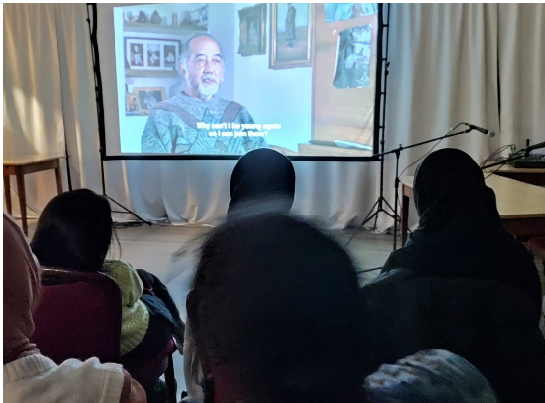
Vorführung "Eksil", Bremen, 22. Oktober 2023